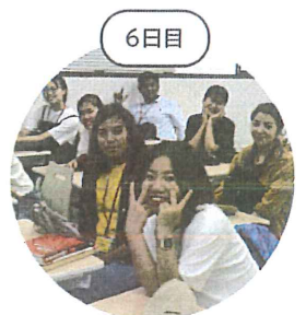
勉強にもしっかり 取り組みます。