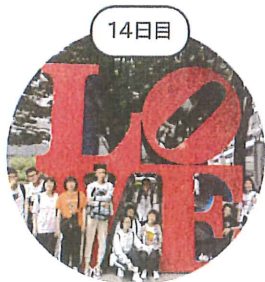
あつという間の2週間！ たくさんの思い出 とともに帰国です。