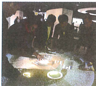
博物館で福岡の歴史に触れる