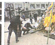
伝統行事・どんど 焼きに参加！