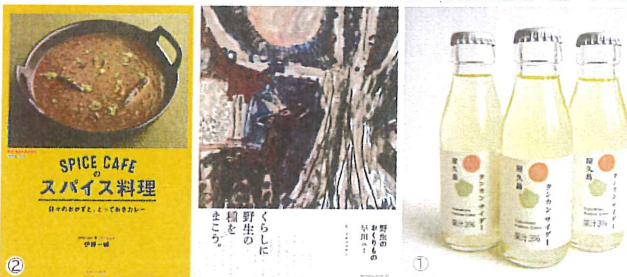
地方貢献事業 & 出版事業 1. 第1次産業支援 2. 出版事業