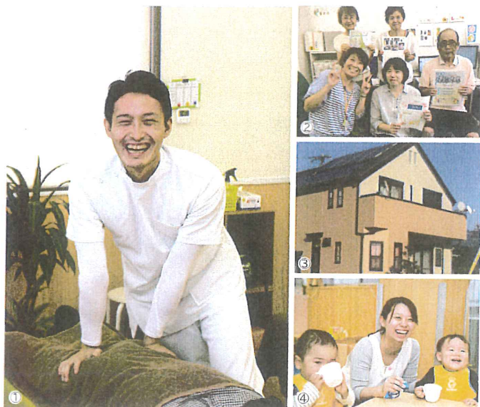
ライフサポート事業 1. 介護 2. 生涯学習 3. 住環境 4. 保育

“教育”が主な事業領域のグループです。事業内容は、幼児教育から生涯学習のサポートまで多岐にわたります。学校や塾などの指導の現場以外にも、出版や保育、介護など、豊かな暮らしのお手伝いをしています。グループ全体での生徒数は約17万人です。