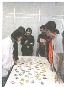
初めてのカルタ体験！