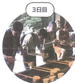
神社へお参り 旅の安全を祈願しました！