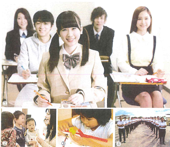
教育事業 1. 通信制高校 2. 英会話教室 3. プログラミング教室 4. パイロットスクール