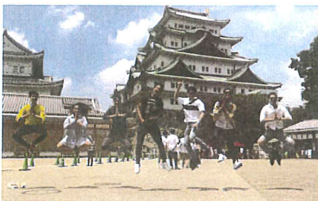
名古屋城でお殿様気分