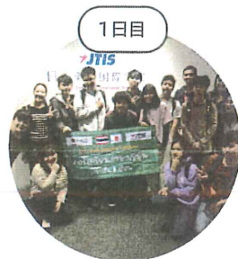
オリエンテーション

こちらはJTISで2週間滞在した場合の一例です。他にもさまざまなアクティビティをご提案できます。価格は107,000～187,000円で、部屋タイプによって値段が異なります。