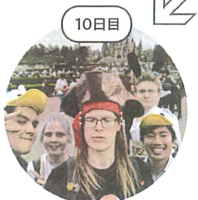
東京ディズニーランド を満喫！

各校、それぞれの地域性を活かした楽しいアクティビティを用意しています！ ※写真は一例です。