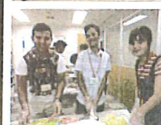
お好み焼き作りに挑戦